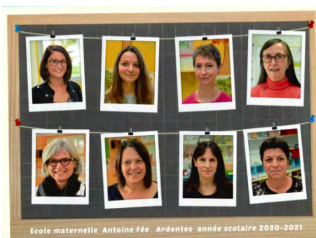
Ecole Antoine Fée