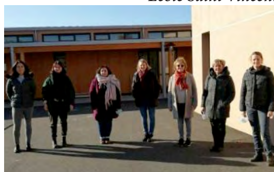
Ecole Saint Vincent